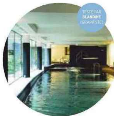
L'HÔTEL LES COMTES DE MÉAN À LIÈGE