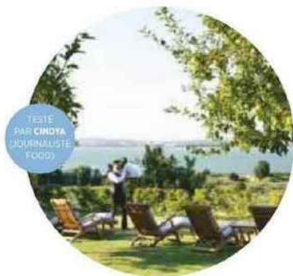
LA FERME SAINT-SIMÉON À HONFLEUR