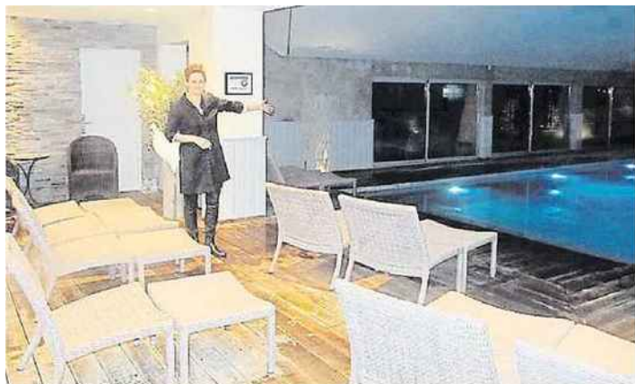
Le spa de l'hotel Antares avec piscine couverte (a droite) donnant sur le Pont de Normandie

Pour la Saint-Valentin, nous avons repéré pour vous les hôtels proposant l'accès à leurs sauna, hammam, piscine... L'occasion d'une escapade en amoureux.