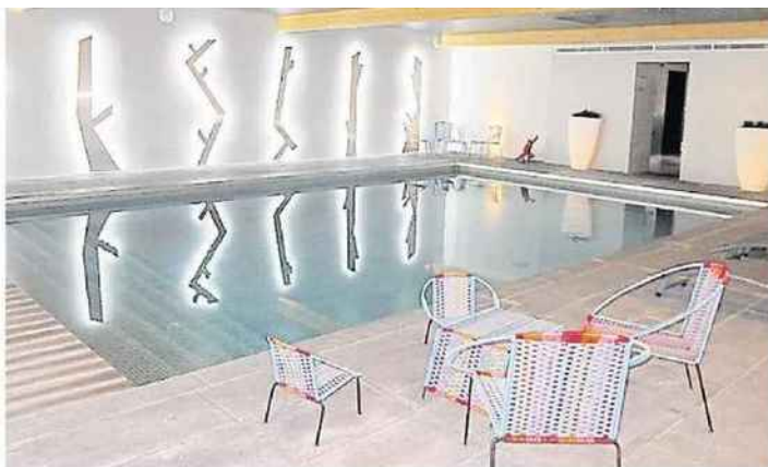
Le spa de l'hotel M propose piscine hammam et sauna dans un decor moderne