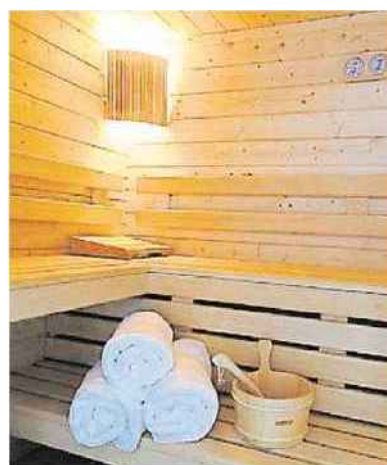
L interieur du sauna de type finlandais du tres cosssu Manoir des impressionnistes