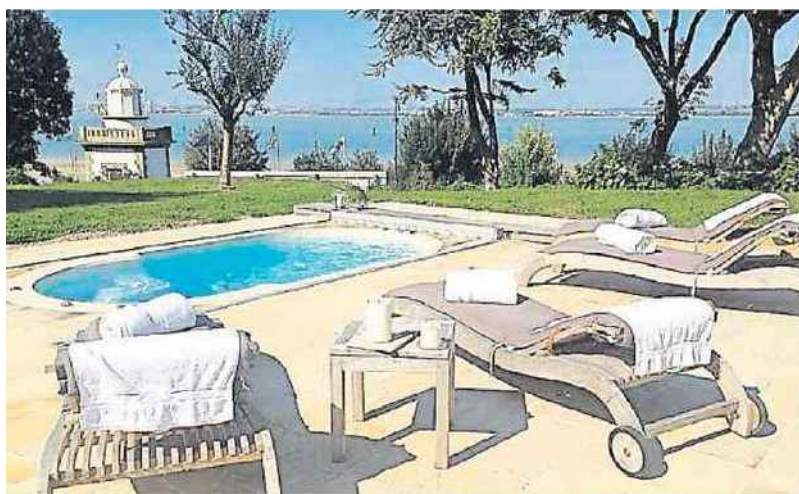
Le spa privatif du Manoir des impressionnistes est dote d'un spa de nage exterieur chauffe donnant sur la mer et le phare du Butin