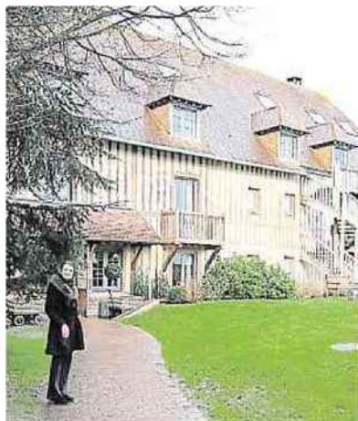
Le luxueux spa de la Ferme Saint Simeon niche dans un bâtiment a pans de bois